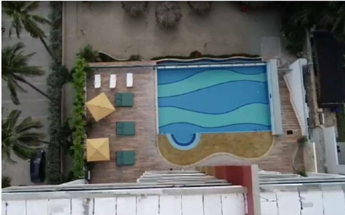
Fotografía aérea Centro Vacacional Santa Marta.